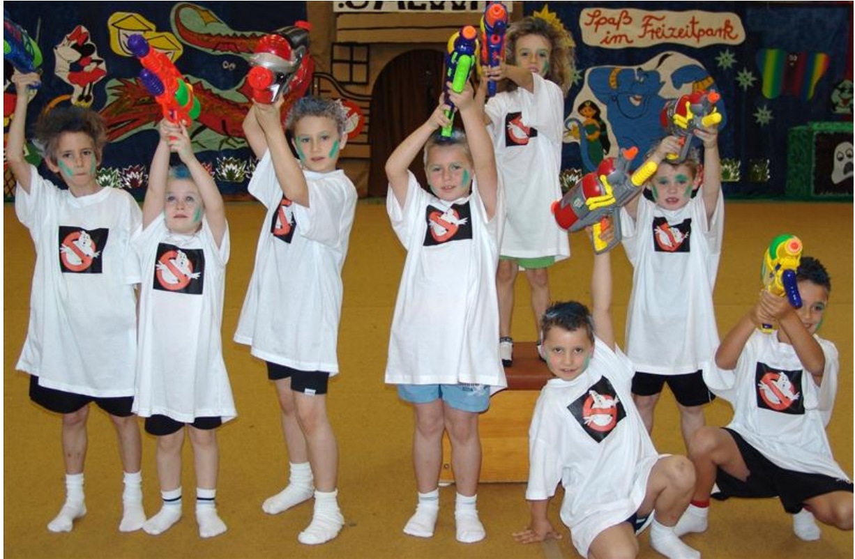
.....jede Menge Ghostbusters begeisterten das Publikum