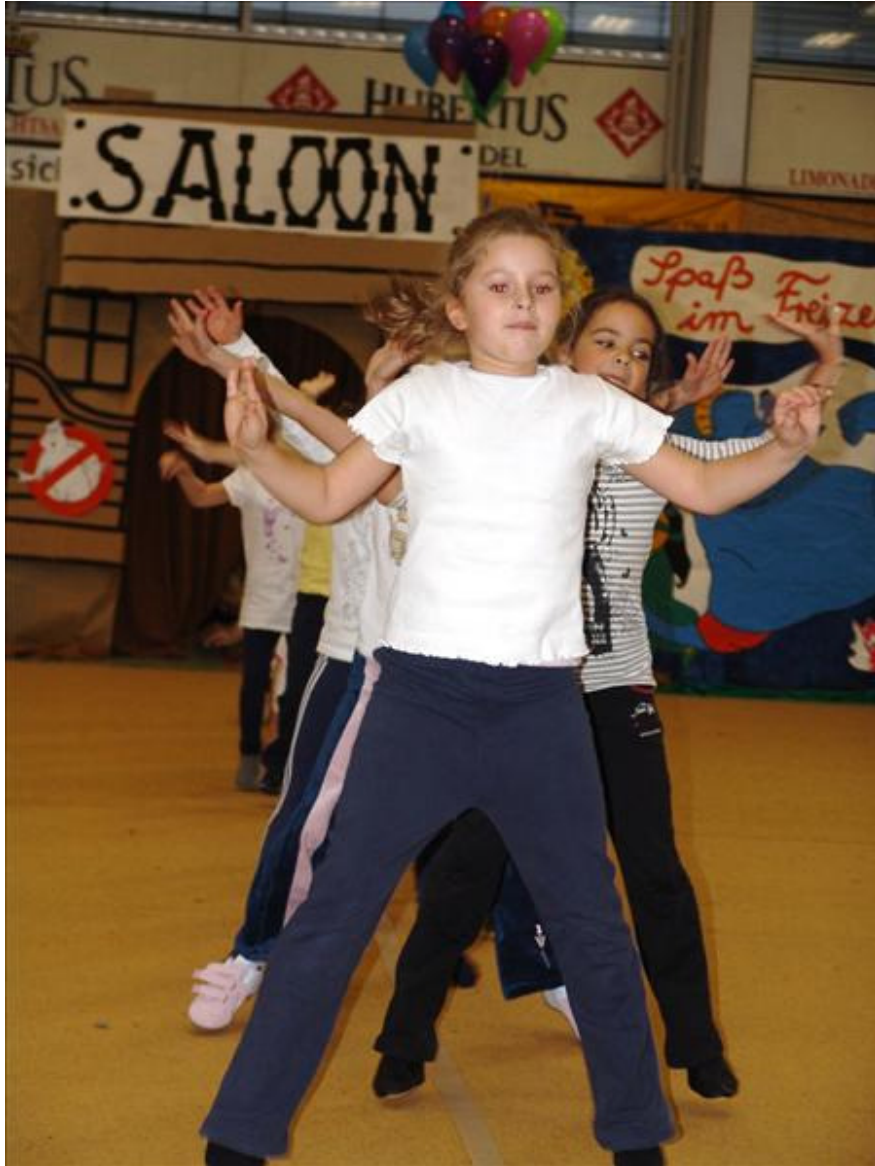
Fahrten mit der Achterbahn