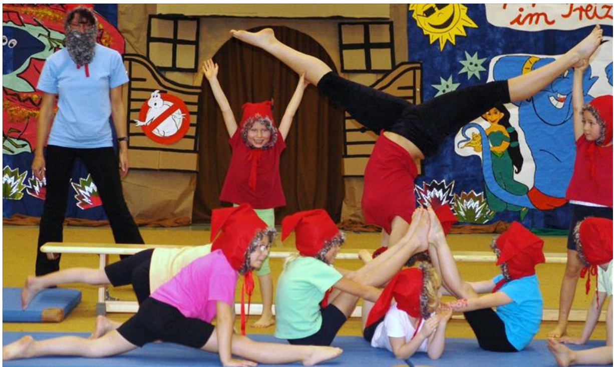
Mit „Hohihooooo…….“ zogen die kleinen Zwerge ein