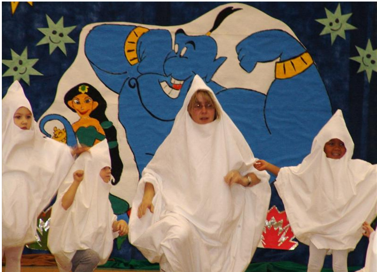
Kleine Gespenster und .....